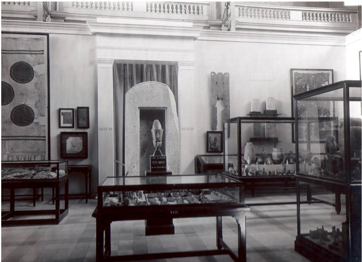
Les salles du MRAH en 1905.

Le cours portera sur l'histoire des musées et collections d'archéologie égyptienne, et leur évolution du début du XIX e siècle à nos jours. Il abordera des thématiques qui ont structuré la réception des objets égyptiens depuis les débuts de l'Égyptologie : la constitution des grandes collections et les pratiques muséales mises en œuvre (muséographie, restaurations, expositions temporaires, etc.). L'étude de cas de la collection des Musées royaux d'Art et d'Histoire (MRAH) complètera chacune de ces approches.